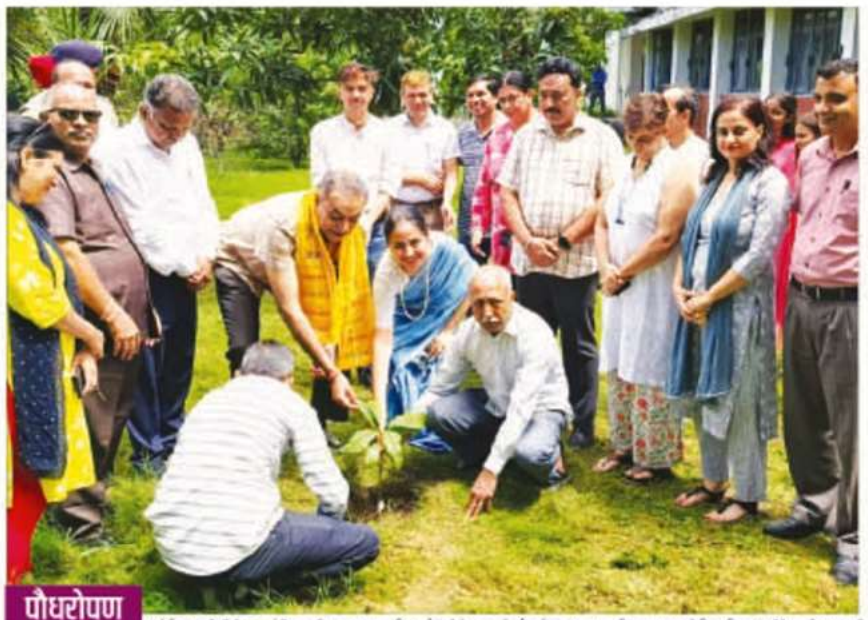
बंडीयड्डा वीधीई 20, वंबीयड् की एनएसएस पूनिट और इंकी क्लब में पीय टेक्स का एक और करण आयोजित किया। कॉलेज की प्राथाधाँ डॉ. सफ्ता मंचा से वर्षियान की सुरुवात की। डी मैन राहुत महाजव में 30 कलों के पेटों का एक बैच प्रधान किया। इस धीमन इमती, एवॉकेटो, वायाय, राहुतूल, ताहवान सिंक - एक असरूव किस्स, मीटिया (स्वांधला), वेरबेट बेरी (फालसा) और वारलीय नावपती (बज्बुग्रोग्रा) महित विभिन्न पीये लगाए पए। कॉलेज के प्राठ्यप्रकों और अन्य स्टाफ ने भी पीछे लगाए। • हिमासल बस्तक